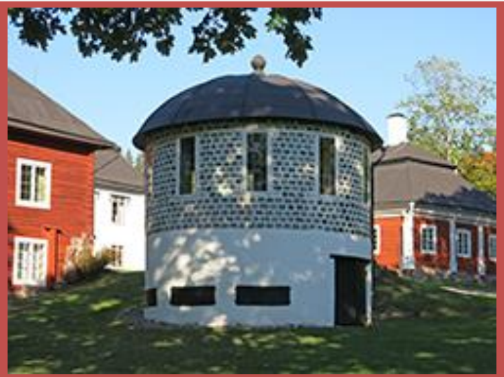
Til venstre: Ludvika gammelgård och gruvmuseum. Til høyre: Världsarvet Engelsbergs bruk