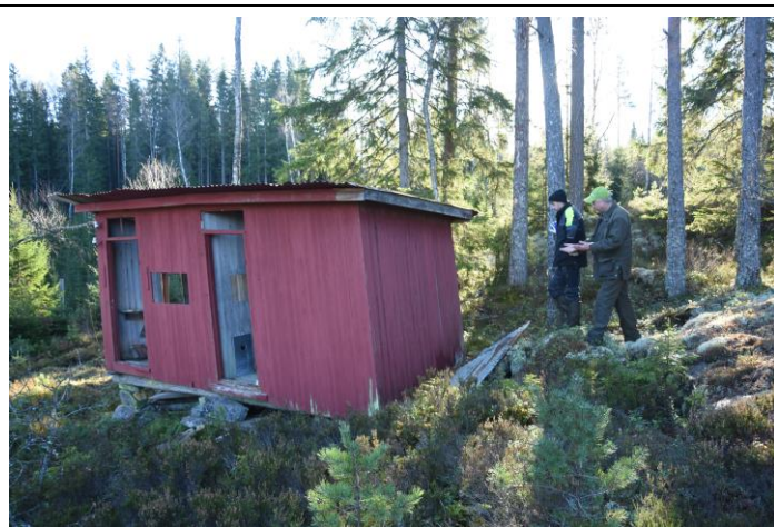
Til venstre: Husgrunden Dalmanns stuga. Til høyre: Skytterhuset ved standplass.

Frammøte: Kl. 12 på Rävlyckan i Rävmarken. Bruk anviste P-plasser