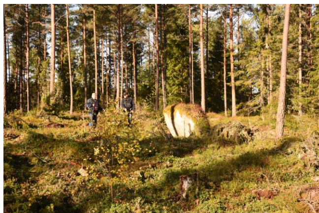
Til venstre: Vilhelms stuga. Til høyre: Vilhelmssnaret.