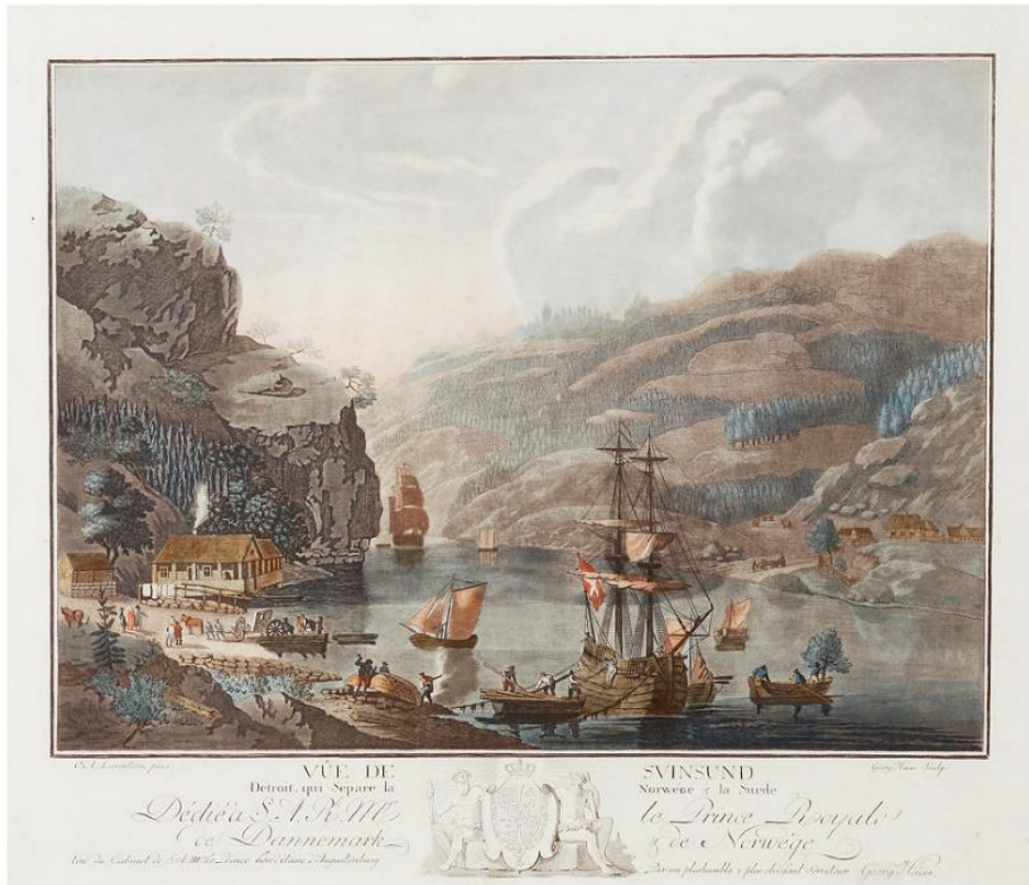
Svinesund 1790-tallet. Kobberstikk stukket av Haas etter maleri av CA Lorentzen.