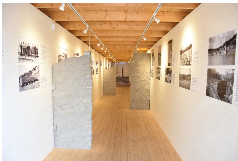
Monolittbruddet – der den store granittblokka 470 tonn ble tatt ut til Gustav Vigeland verdensberømte kunstverk «Monolitten» og som i dag troner i Norges største turistattraksjon Vigelandsparken i Oslo.

Monolittbruddet som siden høsten 2021 er en del av Økomuseum Grenselands besøksmålsportefølje, har godt besøk (ved opptelling i gjestebok: ca. 5000 pr. år) og er ett av de bedre besøkte attraksjoner i Halden kommune.