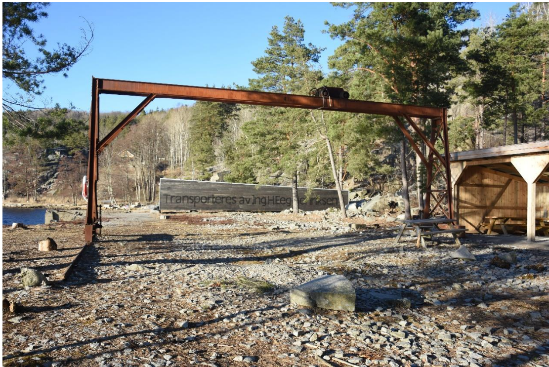
Monolittbruddet med traverskran og deler av hoggeskuret. Bak ser vi kopien av granittblokka som ble fraktet til Frognerparken.

I 2023 gikk den treårs samarbeidsavtalen, 2021-2023, mellom vertskommunene og Ekomuseum Gränslund. 25. april hadde foreningen invitert vertskommunene til et fellesmøte på rådhuset i Halden. Vi orienterte om bakgrunnen for Ekomuseum Gränslund og hva vi arbeider med. Dessuten diskuterte framtid og grunnlaget for ny treårsavtale. Et meget positivt møte – uten at noe var bundet opp. Dagen ble avrundet med en båttur med MS Tista (i regnvær) på Iddefjorden og besøk i Monolittbruddet. Det ble servert lunsj om bord etterfulgt av kaffe og kringle på hjemturen.