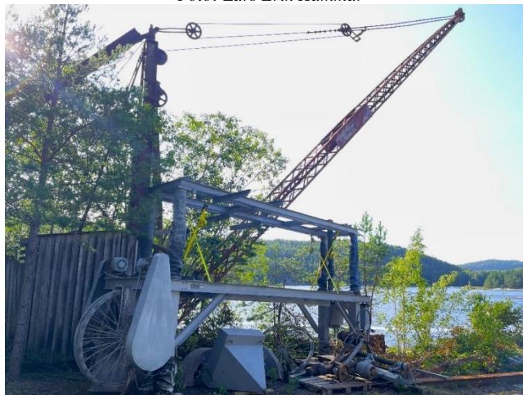
Wiresaga er tatt hut av saghuset og satt midlertidig inn til krana – som også skal flyttes.