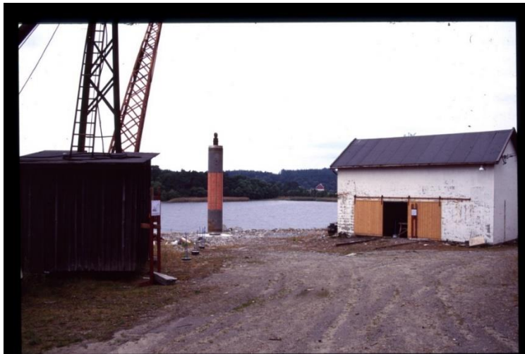
Fagerholt Monumenthuggeri – Krana til venstre og wiresaghuset til høyre.