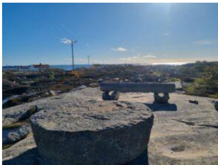
Berättarbänken på Bohus Malmön.

Eftersom det finns mer att berätta än vad som finns plats för på tavlorna, leder QR-koder som man läser av med en smartphone på tavlorna till Internetsidor som berättar mer, bl.a. ljudfiler med berättelser.