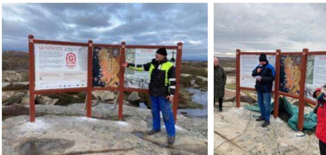
Innvielsen av ”Berättarbänken” og informasjonsskilt på Bohus Malmön.

”Stenbänken” på Draget är en nio ton tung s.k. varg, en misslyckad kvarnsten avsedd för maskiner som förr malde träflis till pappersmassa. Sådana levererades till pappersindustrier både i Sverige och utomlands i stora antal. Den tål att sitta på och ta en fika medan man lyssnar till berättelserna!