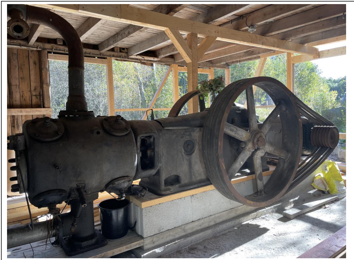
Galärvägen – transporten fra hamnen til Strömsvatnet. Kärleksudden er nå Kompressoren fra Fagerholt Monumenthuggeri – nå nymontert i kompressorhuset på Skriverøa.