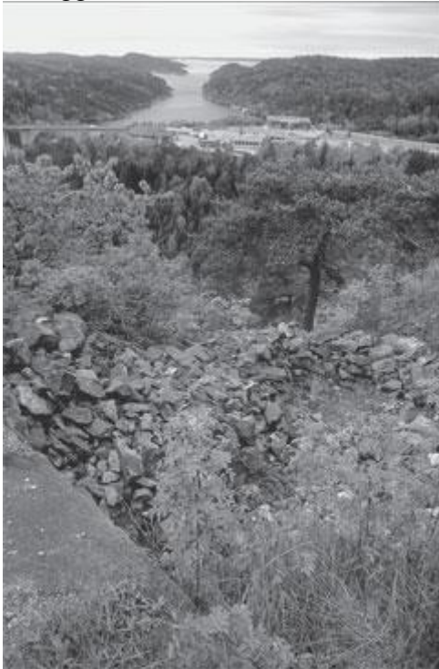
Hjelmkollens utkikksposter og sikt mot Iddefjordens utløp.

Anlegget ble fredet ved forskrift 06. 05. 2004