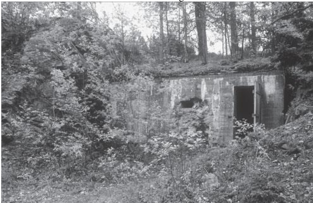
Vestre forlegningsbunker, eksteriør